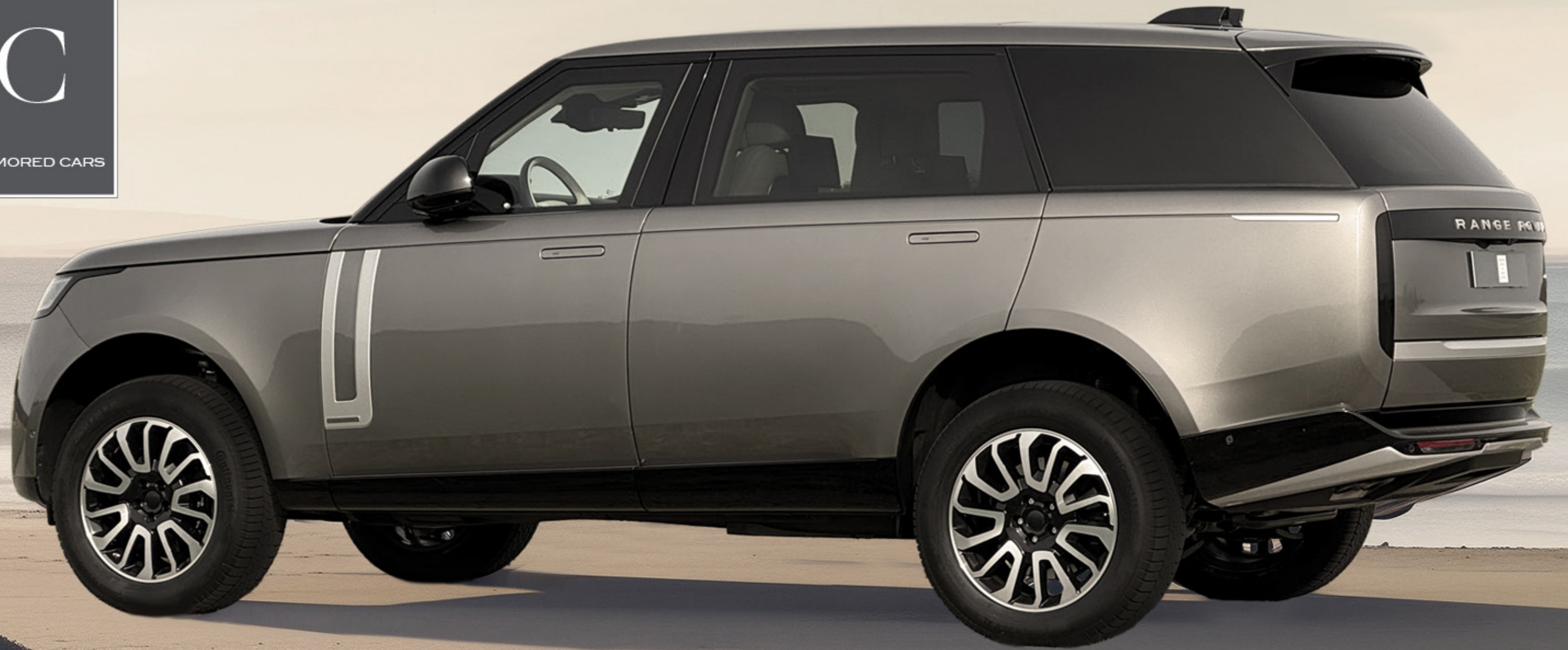
RANGE ROVER EWB Bulletproof Armoring acc. to VPAM7