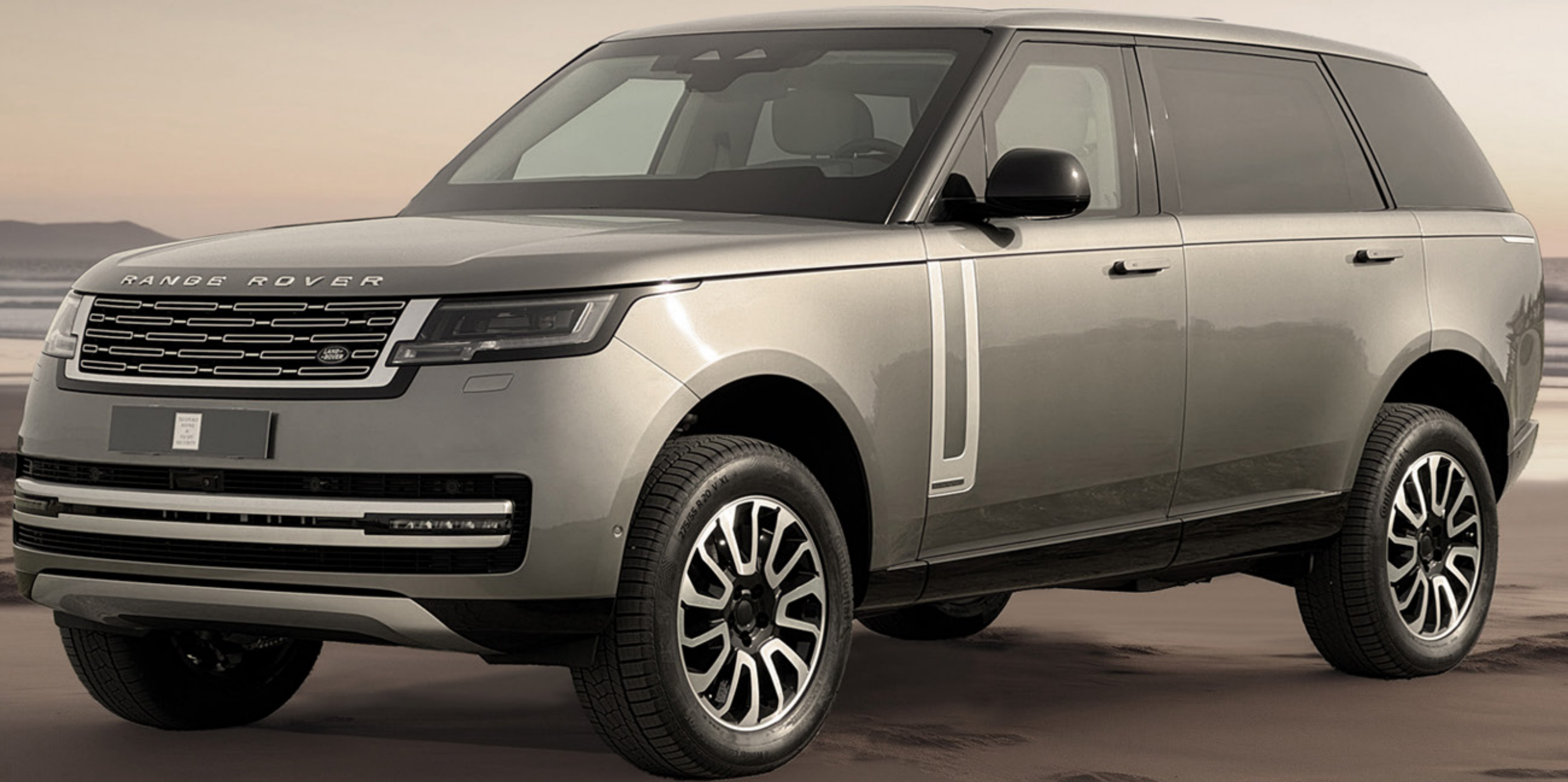
RANGE ROVER EWB Bulletproof Armoring acc. to VPAM7