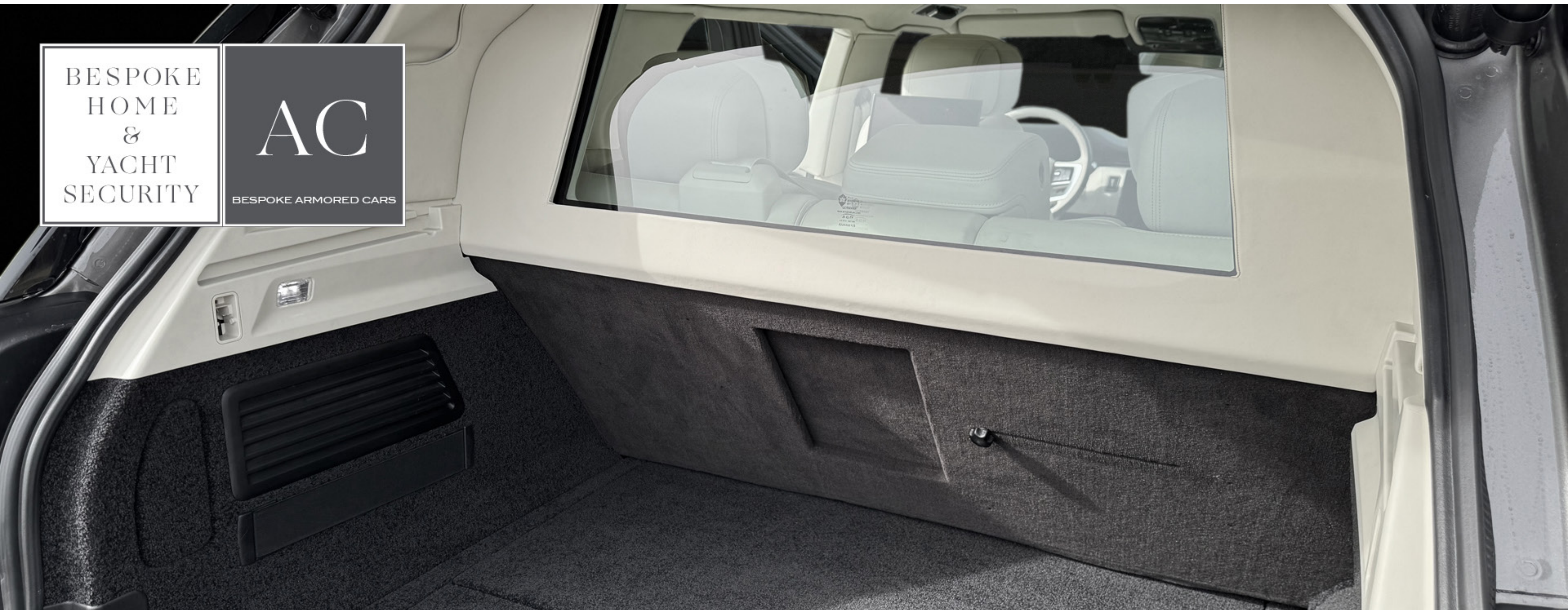
RANGE ROVER EWB Bulletproof Armoring acc. to VPAM7